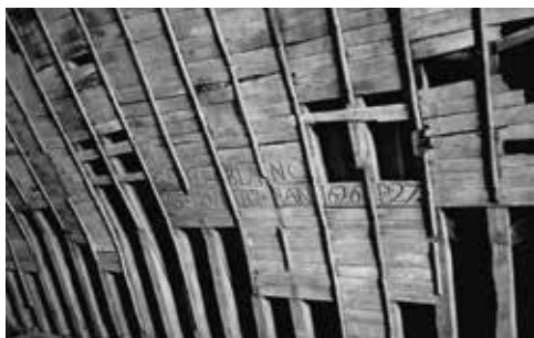
Charpente de la cathédrale Saint-Pierre