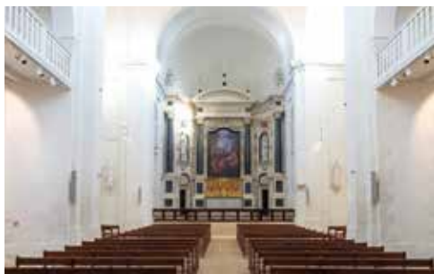
Intérieur de la chapelle Saint-Yves