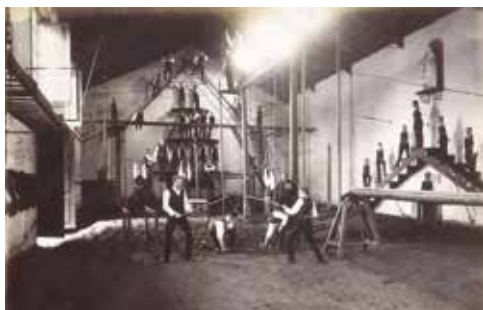
La salle de gymnastique du collège Saint-François-Xavier

Les deux thématiques retenues pour les Journées européennes du patrimoine 2023 s'inscrivent dans une double actualité : le 20 e anniversaire de la convention Unesco pour la sauvegarde du patrimoine culturel immatériel, et l'Olympiade culturelle qui accompagne les Jeux olympiques et paralympiques de Paris 2024.