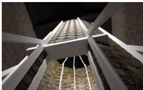
Vue 3D de la structure © Barreau Charbonnet 2023