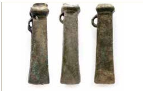
Trois haches à douille du dépôt de Plumergat.