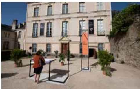
Centre d'interprétation de l'architecture et du patrimoine - Hôtel de Limur