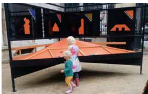
Jeu dans la cour de Limur