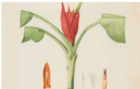
Bananier à fleurs écarlates.