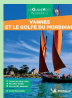
GUIDE VERT MICHELIN