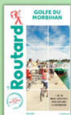
GUIDE DU ROUTARD